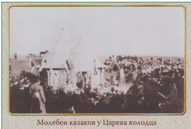
Молебен казаков у Царева колодца

До нашего времени часть срубов в этом колодце сохранилась. Чаениями местных жителей источник жив и поныне.